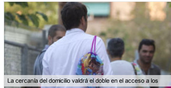
La cercanía del domicilio valdrá el doble en el acceso a los