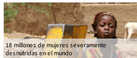
18 millones de mujeres severamente desnutridas en el mundo