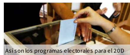
Así son los programas electorales para el 20D