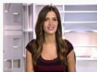
Sara Carbonero deja Telecinco y ya hay... (CADENA DIAL)