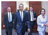
Obama revive in extremis su plan comercial... (EL DIARIO)