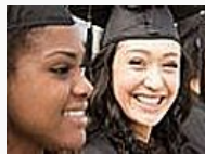
El éxito se construye día a día, descubre... (ME ENCANTA)