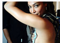
Los tatuajes de los famosos (PEOPLE EN ESPAÑOL)