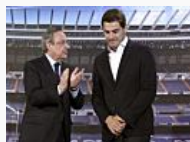
Florentino: "Casillas se quería ir porque..." (AS.COM)