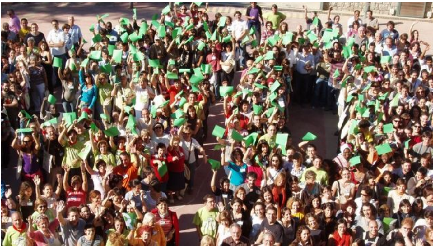
La participación ciudadana es fundamental para la calidad de la política.

Las investigaciones judiciales y policiales en marcha que afectan a varios partidos dibujan un escenario en el que se antoja difícil poder recuperar la credibilidad . Probablemente en las elecciones generales que tenemos por delante sabremos si los votantes penalizan esos casos de corrupción y si el gobierno resultante está dispuesto a tomar una actitud real de penalizar y acabar con este mal.