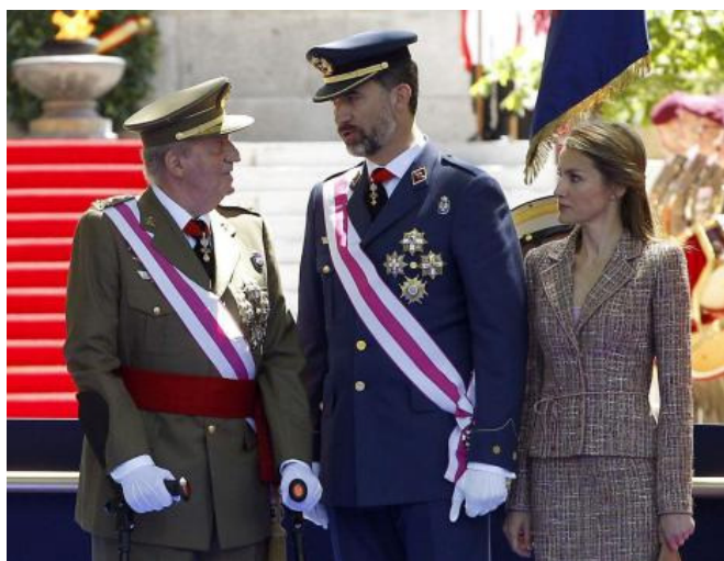
La Casa Real es una institución a la que se demanda un esfuerzo de transparencia en sus cuentas

De momento, el proyecto de ley ( ver aquí ) continúa su tramitación. Se espera que tras su aprobación nos permita contestar a preguntas como estas: ¿Con quién se reúne Rajoy? ¿Cuánto dinero gasta la Casa Real en corbatas, peluquería... o incluso papel higiénico? “Detecto muchas reticencias de los políticos cuando hablamos de esto, sobre todo en los partidos con más poder, que por cierto son también los más afectados por casos de corrupción”.