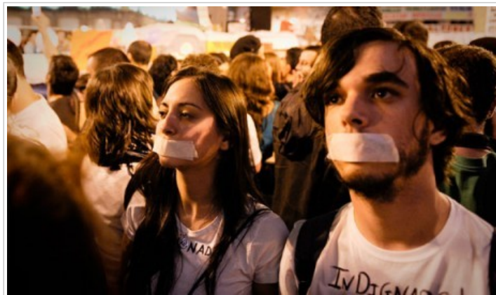
"Indignados su se previše usredotočili na vlastitu dinamiku, tj. na način funkcioniranja kroz plenum."

Konkretno, ovaj zakon u Španjolskoj ograničava definiciju javne informacije. Ima previše izuzetaka kad je riječ o podacima iz sfere ekonomije, zaštite privatnosti. Ima mnogo kritika. No bit će zanimljivo vidjeti kako će različita ministarstva i organi vlasti, prihvatiti činjenicu da će morati stalno objavljivati podatke, od toga kako pacijenti vrednuju liječnike do toga kako funkcioniraju različiti sustavi obrazovanja, srednje škole, itd.