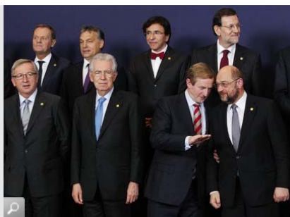
Reunión de los Jefes de Estado y de Gobierno de la Unión Europea

Acces Info Europe , ONG pro-transparencia, topó con este problema en el 2008, mientras los Estados debatían reformas legislativas sobre la Ley de Transparencia Europea. La ONG denunció el caso al Tribunal Europeo de Justicia , que le dio la razón en 2011 y se la ha vuelto a dar de forma inapelable en 2013. España , Francia y la República Checa fueron los países que apelaron la resolución de 2011, y, Grecia, el Reino Unido y el Parlamento Europeo han apoyado a la ONG en el juicio.