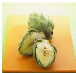
Esta semana: Alcachofa