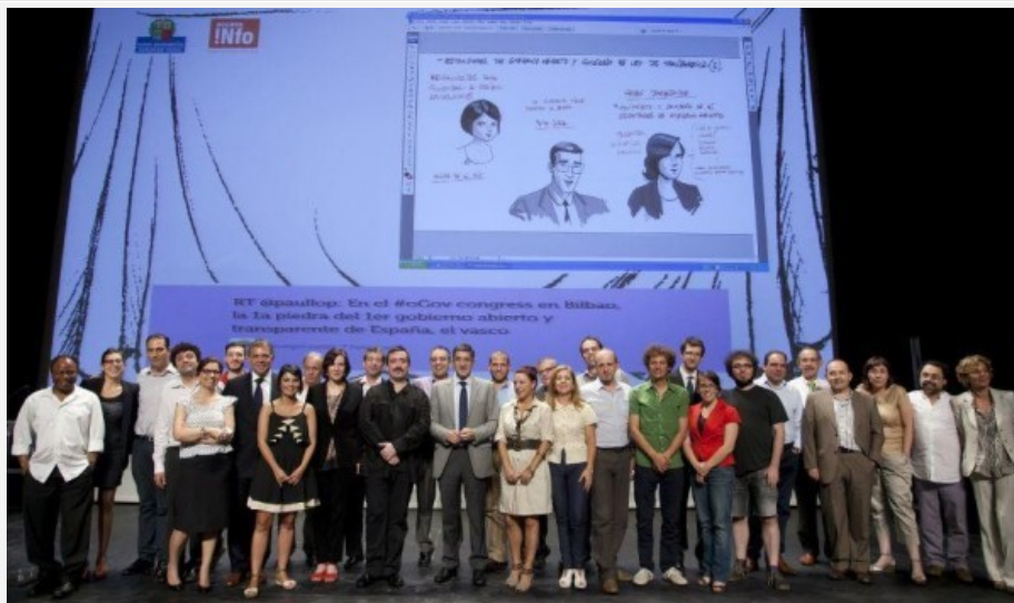
Los participantes ayer en la jornada para debatir el Anteproyecto de Ley de Transparencia y Buen Gobierno de Euskadi

Ayer participé junto a otras muchas personas en una jornada de trabajo en torno a la Ley de Transparencia y Buen Gobierno de Euskadi en el Teatro Campos de Bilbao, invitado por el Gobierno Vasco (seguimiento twitter: #oGov ). Una experiencia para mí reveladora que culminó al final de la tarde con un discurso del Lehendakari Patxi López que convirtió lo que era un borrador en un Anteproyecto de Ley, presentado con bastante énfasis por López, que llegó a decir que la única manera de recuperar la confianza de la ciudadanía en los políticos y la administración es “abriendo puertas y ventanas sin excusas”.