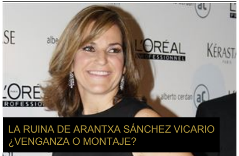
LA RUINA DE ARANTXA SÁNCHEZ VICARIO ¿VENGANZA O MONTAJE?