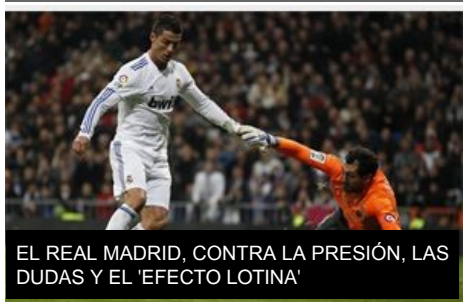
EL REAL MADRID, CONTRA LA PRESIÓN, LAS DUDAS Y EL 'EFECTO LOTINA'