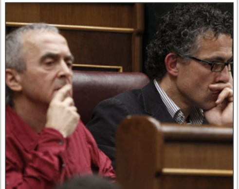
Rajoy y Soraya Sáenz de Santamaría antes del pleno