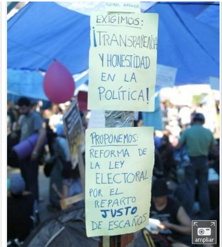
Carteles a favor de la transparencia en el 15-M.- SAMUEL SÁNCHEZ

La ley obliga a la Administración a poner a disposición del ciudadano toda información pública sin necesidad de que este la reclame, pero además, la que no está sujeta a publicidad activa podrá ser solicitada sin invocar la motivación. La información podrá ser limitada o denegada cuando afecte a la seguridad pública, los secretos de Estado, las investigaciones penales o disciplinarias, el derecho a la intimidad, la protección de datos o aquella que afecte a los