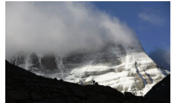
Las montañas, majestuosas y enigmáticas