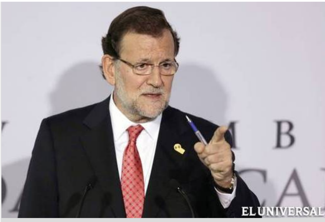
Mariano Rajoy quiere atacar la corrupción en España