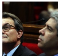
Mas dice sobre la consulta soberanista: "en los momentos clave dará la