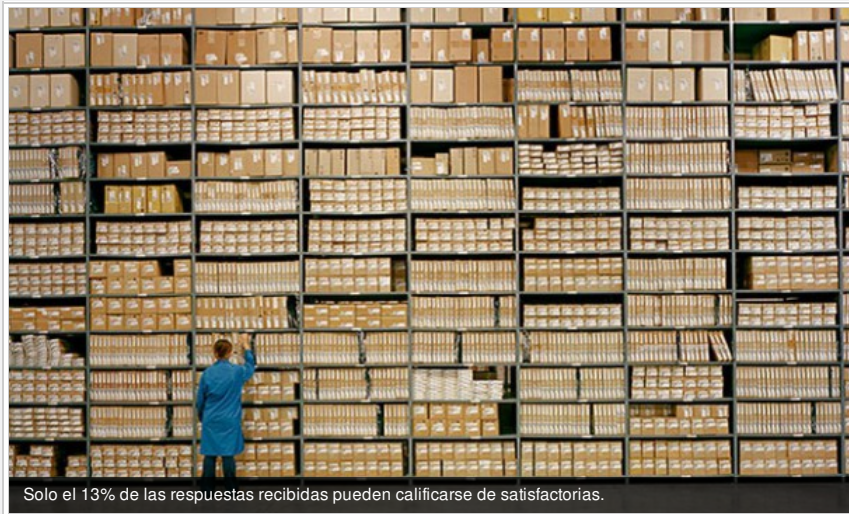
Solo el 13% de las respuestas recibidas pueden calificarse de satisfactorias.