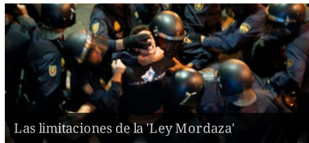
Las limitaciones de la 'Ley Mordaza'