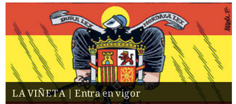
LA VIÑETA | Entra en vigor