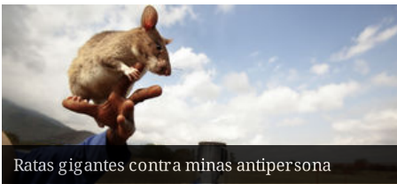
Ratas gigantes contra minas antipersona

Temas del día: Grecia, Ley Mordaza, Relevo en Educación, Caso ERE, Pedro Sánchez, Podemos