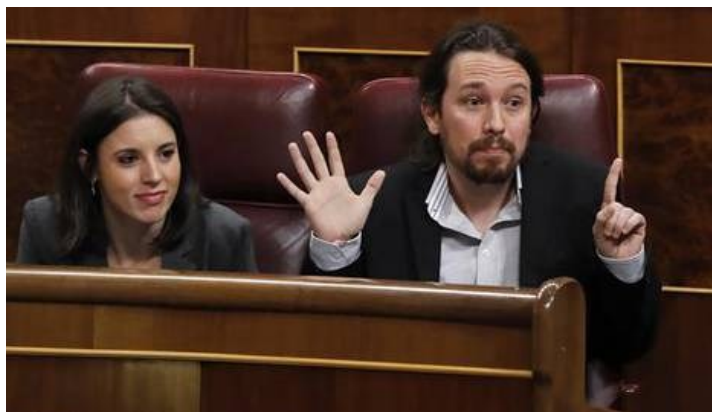
El líder de Podemos, Pablo Iglesias, junto a la portavoz del partido, Irene Montero.

El PSOE pide al diputado de Nueva Canarias que mantenga hasta el final su 'no' a los Presupuestos