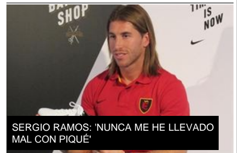
SERGIO RAMOS: 'NUNCA ME HE LLEVADO MAL CON PIQUÉ'