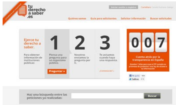
La página de inicio del sitio web www.tuderechoasaber.es .

También se pueda encontrar una guía para solicitantes en la que señalan cómo se debe realizar la petición para facilitar el