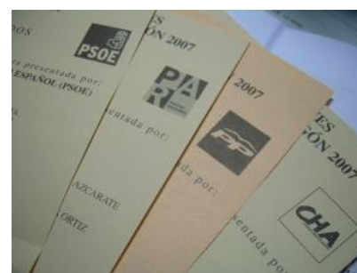
La inclusión de los partidos en la Ley de Transparencia sigue en el aire.

Esta web utiliza cookies que guardan algunas informaciones de tu navegador. Si continúas navegando, nos das permiso para hacerlo.