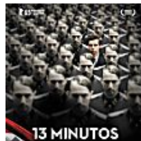
Georg Elser: 13 minutos para matar a Hitler