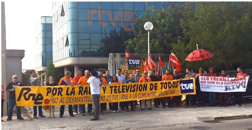
Protestas de los trabajadores de RTVE contra la manipulación política de la radio y televisión públicas

En la exposición de motivos de la Proposición se señala que el derecho a recibir información veraz y el derecho a acceder y hacer uso de medios de comunicación están protegidos por el artículo 20 de la Constitución Española como derechos fundamentales, y que el artículo 20.3 establece concretamente que la ley regulará la organización de los medios de comunicación social dependientes del Estado y la participación de la sociedad en su actividad, respetando el pluralismo social, político, cultural y lingüístico de España.