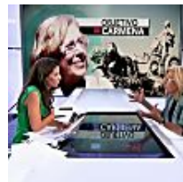
Vergüenza del periodismo español