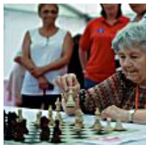
Mujeres y ajedrez el 8 de marzo