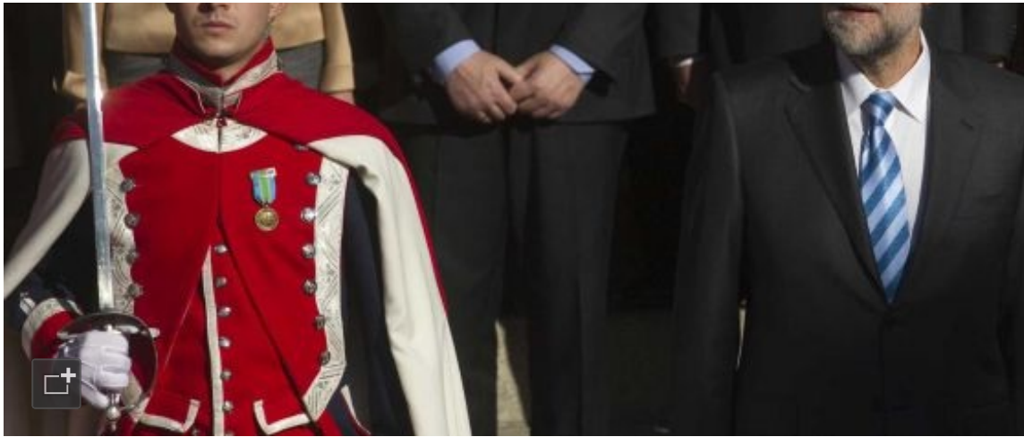
El presidente del Gobierno, Mariano Rajoy, en la apertura de la legislatura de las Cortes.